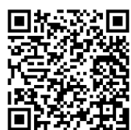
③やまぐち 魅力紹介